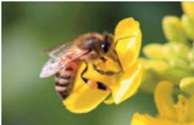
ミツバチ