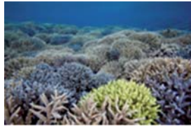
サンゴ礁