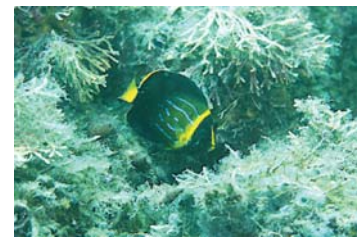
越冬したキンチャクダイ成魚

2つめは、冬の海水温が上昇し、そこに棲む生物が変わってきたことです。昨年の冬の水温は2006年と比べて2℃くらい高くなり12℃で推移しました。そのため、今までは冬になると姿が見られなくなっていた熱帯魚のキンチャクダイの幼魚が二ホンアワサンゴの生息する海で冬を越してしまい、とうとう夏には成魚になりました。