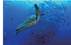
アオウミガメとギンガメアジ