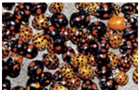
ナミテントウ