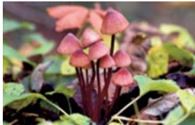
チシオタケ