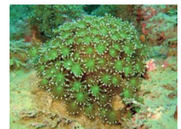
「海の花束」二ホンアワサンゴ

この他にも変わってきたことはありますが、これから先も地球温暖化などの影響を受けて変化していくことと思います。それを皆さんにお伝えするのが私たち海に潜る者の役目だと思っています。