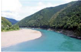
四万十川