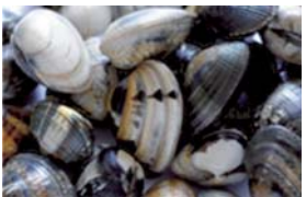
アサリ (C)ふわ しん