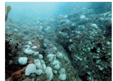
大量に死んだ二ホンアワサンゴ

3つめは、私が15年間観察している二ホンアワサンゴがその間に増え続け、広さは当初の5倍にも広がり3,000㎡、10万個になったことです。3,000㎡の広さとは小学校のプール9つ分です。このまま増え続けるとこの海が二ホンアワサンゴの花園になるのではと思っていましたが、昨年秋に大量に死んでしまいました。被害は10万個の内の6~7割で、その原因は分かっていません。現在その状況は一応収まっていますが、これから先どのようなことになるのか気がかりです。このような事が繰り返し起きると、やがて周防大島の二ホンアワサンゴはいなくなってしまうかもしれません。