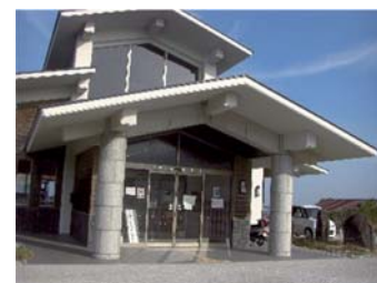
つのしま自然館前景