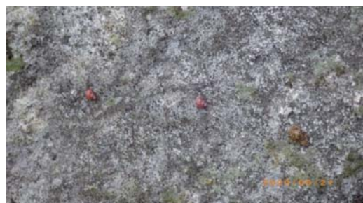
ベニゴマオカタニシ