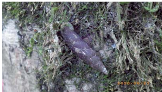
シイボルトコギセルガイ