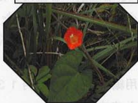
マルバルコウ 愛らしいオレンジの花

日暮ヶ岳の植物観察では、約20種の植物をとりあげ、葉の付き方や茎の形、酷似した植物の見分け方など、その特徴をルーペや五感を使って調べる充実した内容になりました。