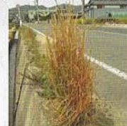
このような状態でも種を飛ばし続ける