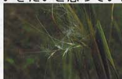
メリケンカルカヤ

http://www.rib.okayama-u.ac.jp/wild/meriken/photo.htm