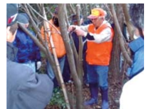
▲わな講習会の開催状況

一人前のハンターになるためにはベテランの方の指導を受けることが一番の近道なので、県では県猟友会と連携して、新規免許取得者を対象とした研修会などを開催しています。