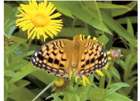
オオウラギンヒョウモン