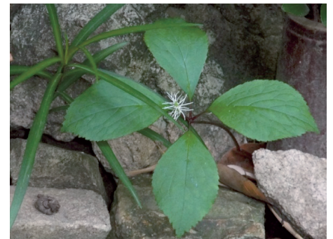
キビヒトリシズカ