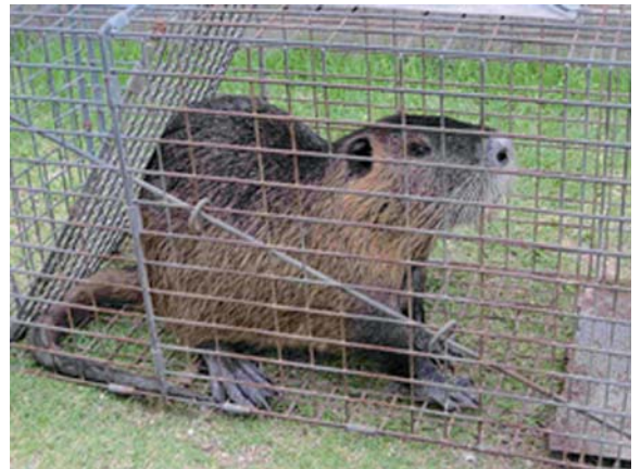
捕獲されたヌートリア

また、平成25年度にはヌートリアによる農業被害も確認されており、年々、その生息域が拡大していることがうかがえます。