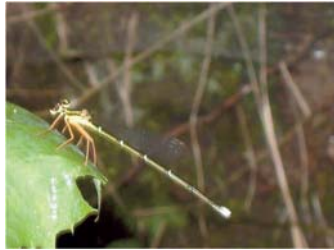
セスジイトトンボ