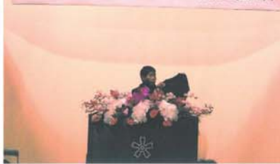
平成21年度 快適な環境づくり岩国地区大会

だから今、現状を知り、気づき、考え、そして行動することの大切さを問いかけています。エコの実践者として、池に投げられた小石のような活動ですが、続けていきたいと思えます。