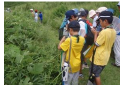
秋吉台で植物観察