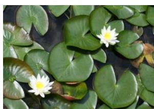
ビオトープのスイレン

人間界で何が起ころうと、自然界は季節を感じながらマイペースで動いているようですね。周りにある自然が私たちがいつも癒してくれているということをお忘れはいけなくて改めて思う今日このごろです。