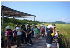
きらら浜自然観察公園 で自然観察