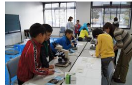
顕微鏡で微生物観察